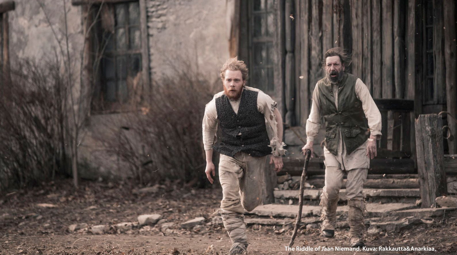
The Riddle of Jaan Niemand.